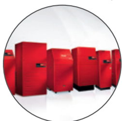
Hoval Générateurs de chaleur

Hoval livre tous les composants pour un système de chauffage et d'aération douce. La régulation système Hoval TopTronic® E relie tous les composants pour constituer un système global efficace. Pour vous, cela est synonyme de commande uniforme et de modules adaptés les uns aux autres.