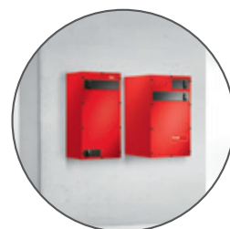
Hoval Aération douce