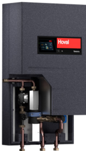
Belaria® pro confort (8, 13, 15)