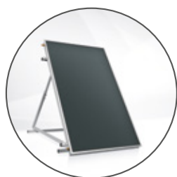
Hoval Impianti solari