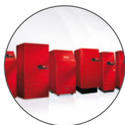
Hoval Generatori di calore

Hoval fornisce tutti i componenti necessari per un impianto di riscaldamento e climatizzazione efficiente. Il sistema di regolazione Hoval TopTronic® E combina tutti i componenti in un efficiente sistema integrato. Questo si traduce in una gestione unitaria e in componenti compatibili tra loro.