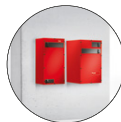
Hoval Ventilazione meccanica controllata